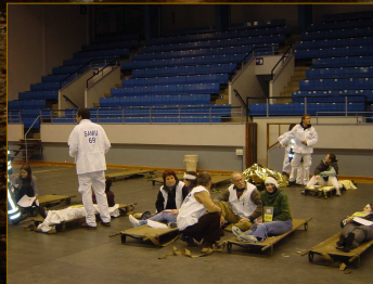
Traitement des blessés