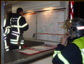
Le PC Avancé