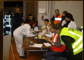
Identification des victimes